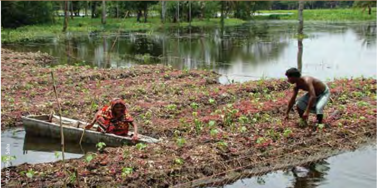
Des agriculteurs travaillant sur leurs jardins flottants au village de Chadra, Jessore, au Bangladesh.