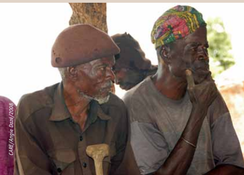
Des seniors de la communauté du village de Bowku, district de Mamprusi Est, au Ghana, discutent de l'impact du changement climatique sur leurs moyens de subsistance et des actions à entreprendre.

Au Ghana, CARE travaille avec les communautés locales afin de promouvoir l'intégration des questions relatives à l'adaptation au changement climatique dans les Plans à Moyen Terme (2010-2015) de deux districts situés au nord du Ghana - East Mamprusi et Bawku. Le processus CVCA a permis d'identifier des questions de vulnérabilité essentielles dans les communautés cibles, en mettant l'accent sur les groupes vulnérables. Le processus a mis en évidence les impacts des changements climatiques dans la région, avec les inondations, les sécheresses et les pluies irrégulières considérées comme des problèmes majeurs pour les communautés cibles. L'analyse a également rassemblé des informations sur la vulnérabilité spécifique des femmes, de qui dépendent pour une grande part le bien-être de la famille. Souvent abandonnées par les hommes de la famille qui émigrent afin de trouver du travail, elles n'ont qu'un accès incertain aux ressources importantes, comme la terre agricole. Cette analyse sert de base au développement de plans d'action communautaires qui identifient les actions prioritaires pour réduire la vulnérabilité au changement climatique.