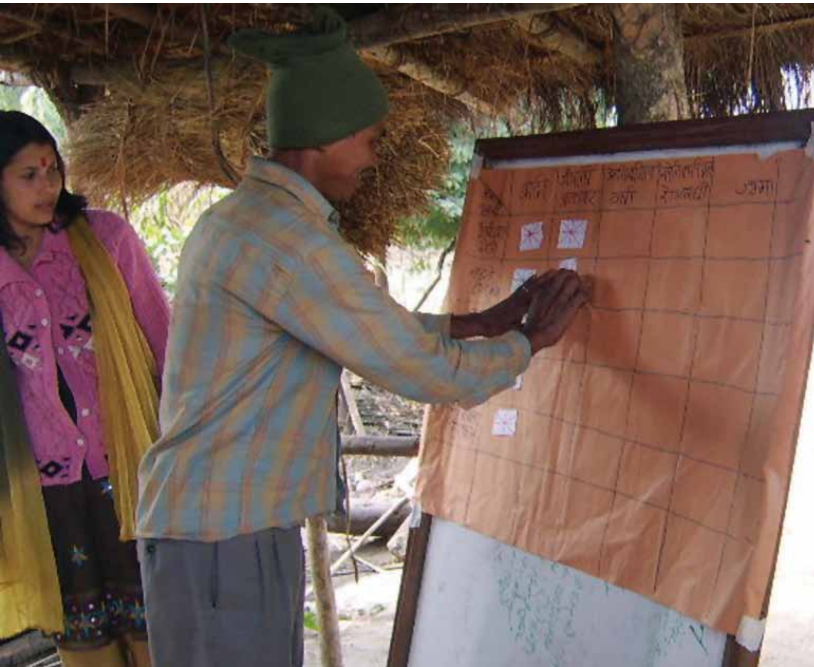
Sous l'œil attentif du facilitateur, un participant népalais note le classement du groupe sur la matrice de vulnérabilité.