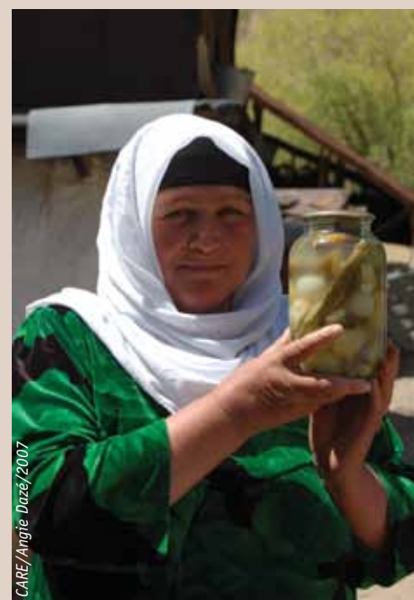
Une femme du village de Panhok au Tadjikistan central, porte un bocal de légumes conservés pour fournir une alimentation variée durant la longue période hivernale.

CARE remercie l'Agence Canadienne de Développement International (ACDI) pour son soutien au projet d'Adaptation au Changement Climatique au Tadjikistan (ACCT).