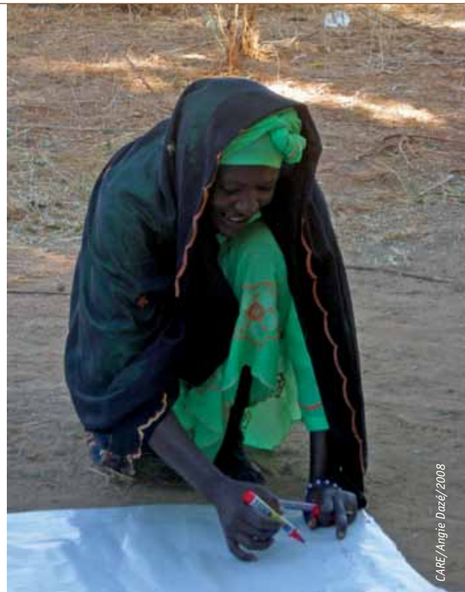
Un groupe de femmes dans le village de Soudoure au Niger, travaille collectivement pour dessiner une carte des risques de leur communauté.